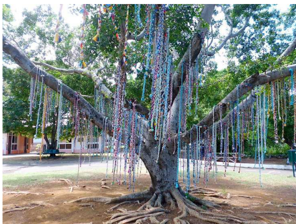
536 tresses, île de La Réunion mars 2019