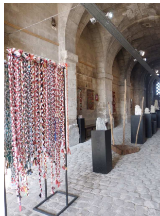
Module d'environ 200 tresses Porte Royale, La Rochelle, 2019